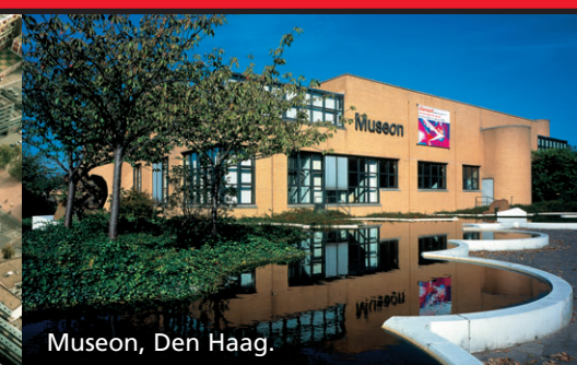
Museon, Den Haag.